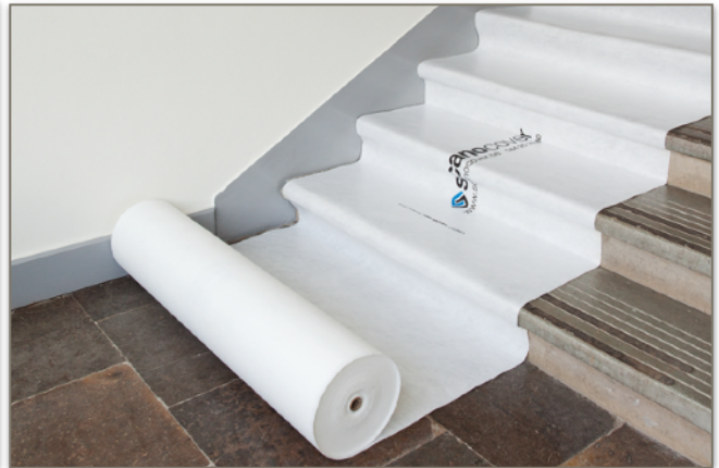
Rulla ut och tryck till på trappstegen, så är det klart.